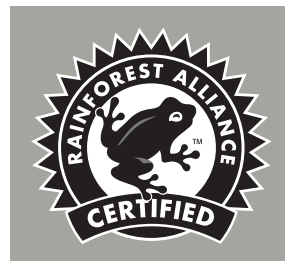
Figura 4. El sello RAC se muestra de manera correcta, colocado sobre un fondo de un solo color (A) y sobre un fondo de colores variado (B). El sello en blanco y negro (C) es para utilizar solamente en material promocional blanco y negro.

Para mayor información vea la sección “Formato de Archivos y Colores de Referencia” en este documento.